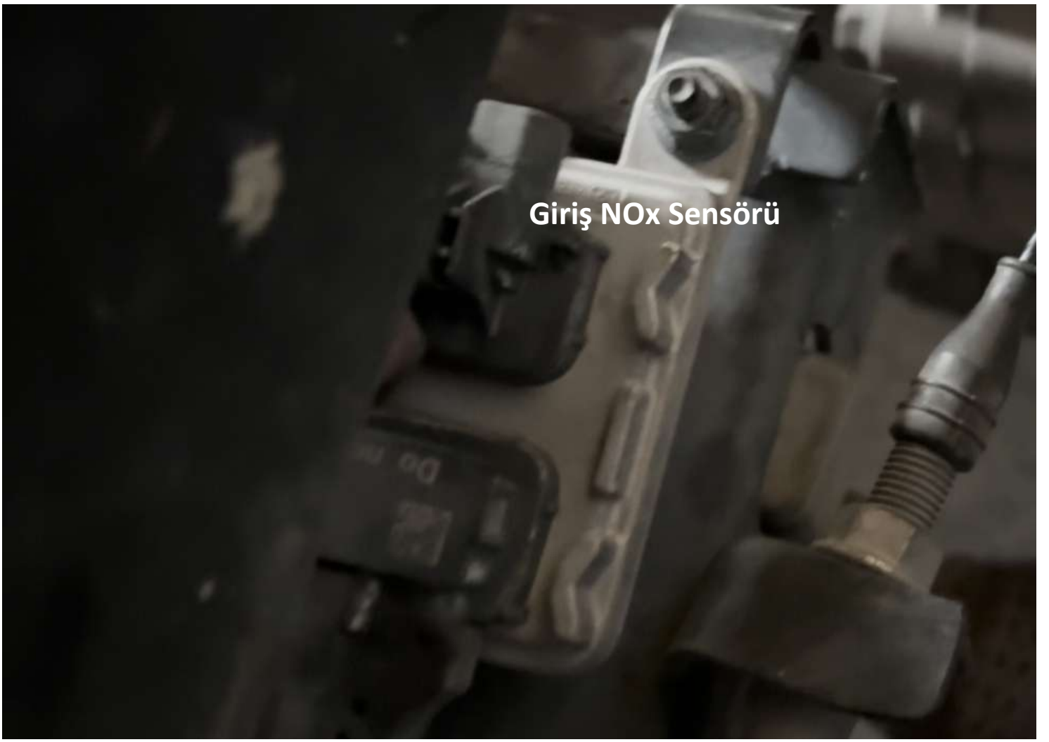
Giriş NOx Sensörü