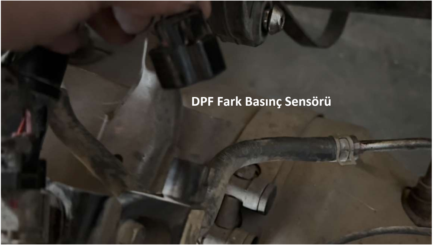
DPF Fark Basınç Sensörü