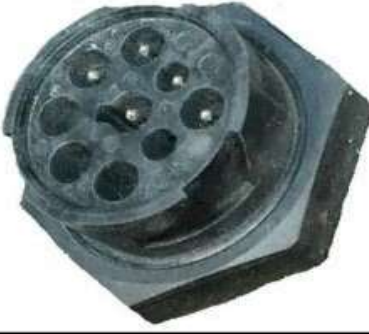
Ford Cargo 1846 - 460 PS - 9 pinli Arıza tespit soketi